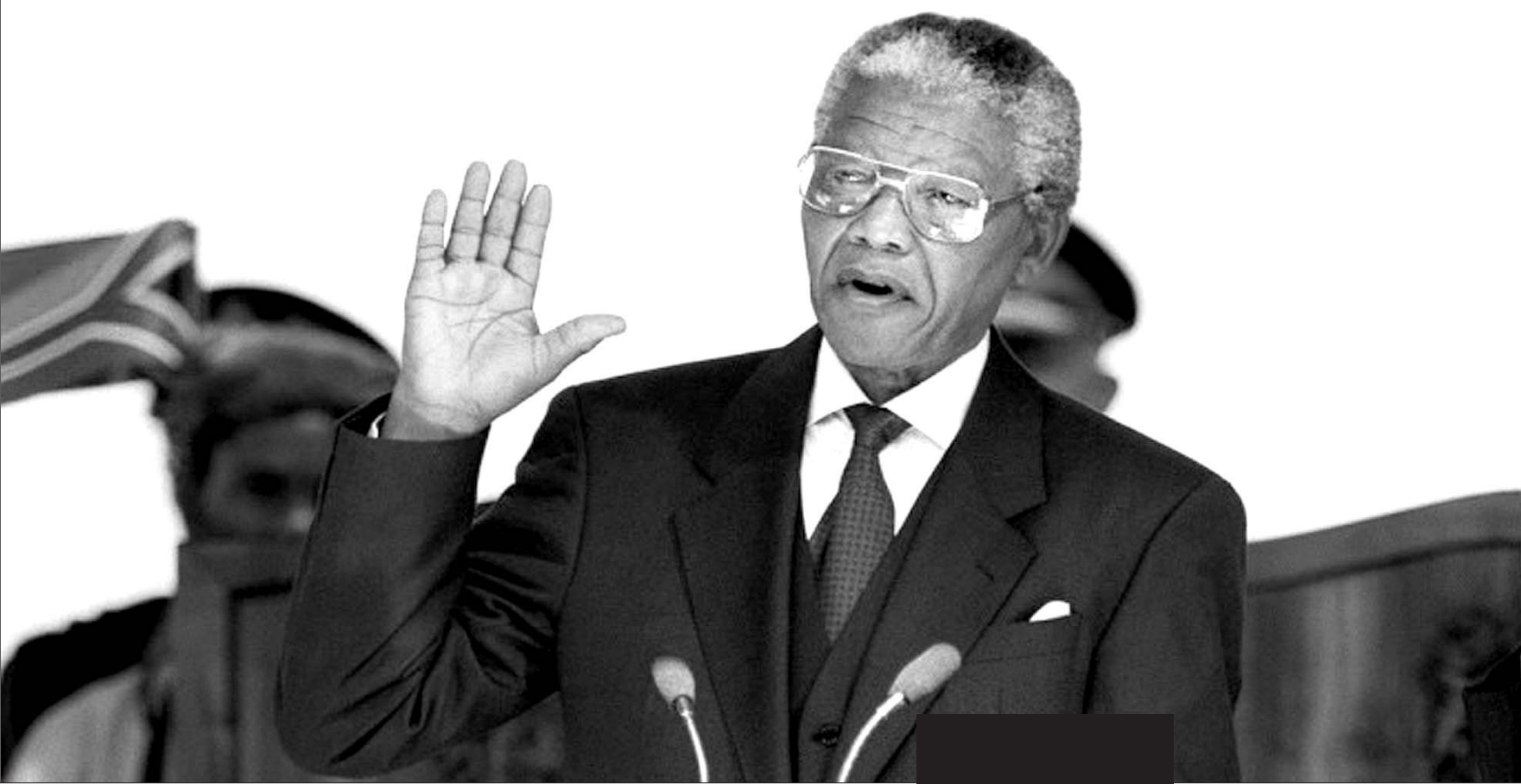
1994年5月10日，曼德拉宣誓就职南非总统。