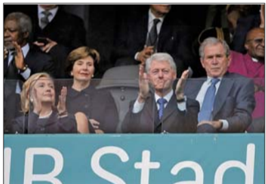
美国前总统克林顿夫妇和小布什夫妇(后排)