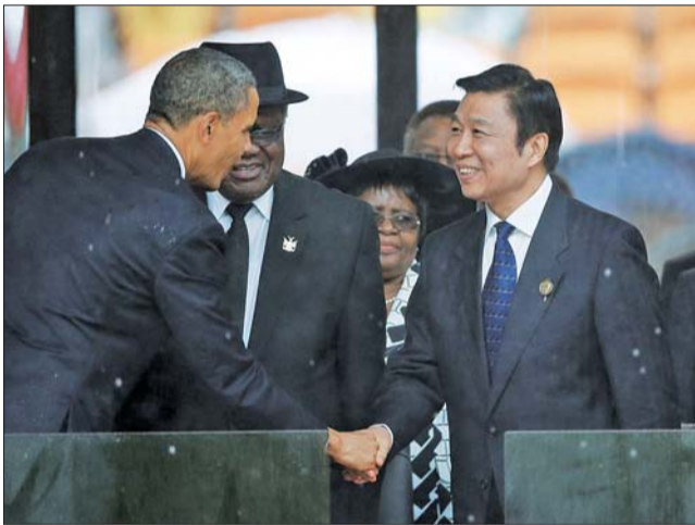
追悼会上,美国总统奥巴马与中国国家副主席李源潮握手。