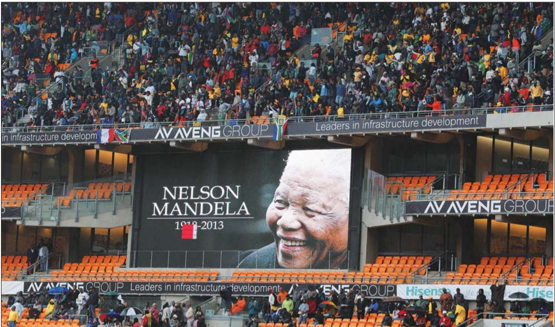
10日,已故南非前总统曼德拉的头像出现在约翰内斯堡FNB体育场的大屏幕上。

近20年过去了,回忆起那一刻,王茜仍是记忆犹新,她甚至一闭上眼就能看到血从黑人身上缓慢地流出来。她说,“华人那时的待遇稍微好点,但白人也基本不用正眼看我们”。曼德拉不仅解放了黑人,也解放了在南非的华人,使我们今天能与所有人都平起平坐。