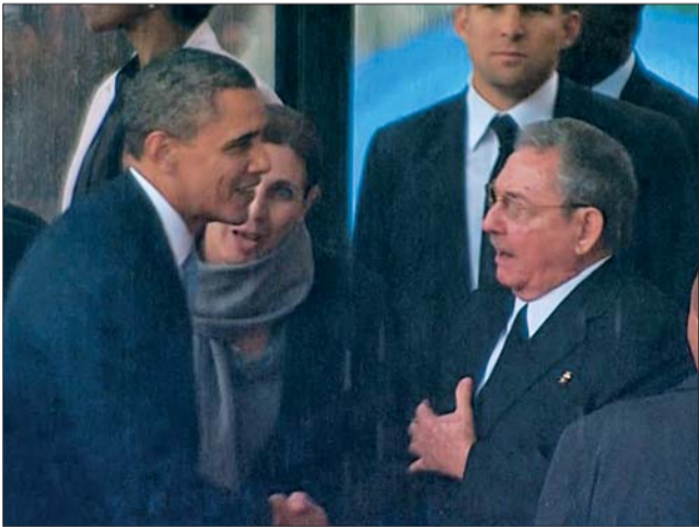
追悼会上,美国总统奥巴马与古巴领导人劳尔·卡斯特罗握手。