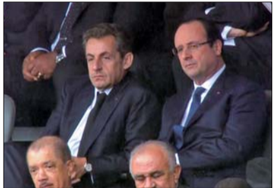
法国总统奥朗德(右)与前总统萨科齐(左)