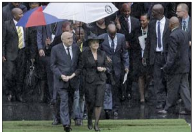
南非前总统德克勒克夫妇(前中)雨中入场