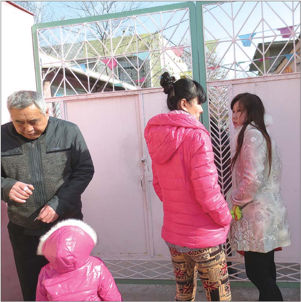
▲10日上午,得知幼儿园要关门,部分家长站在门口,显得很无奈和不舍。

上。”幼儿园周边有不少幼儿园,也有新的幼儿园正在注册,“完全可以接纳。” 至于该幼儿园为了弥补亏损,想要转制的问题,“目前,天桥区教育局没有接到过幼儿园的转制申请。”按照相关规定,幼儿园要进行转制,要报请同级教育主管部门。“该幼儿园要转制应报请省级教育主管部门。”