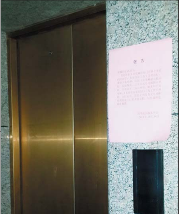
四季花园3号楼西单元的电梯已经停运4个多月了。