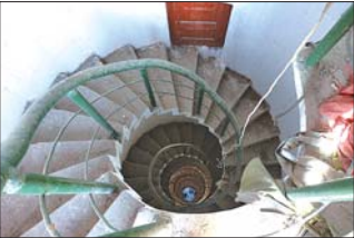
跳伞塔内部楼梯和扶手上布满灰尘。

曾经的辉煌和喧嚣之后,留下的是不少人的追忆和惋惜。跳伞塔和那个时代一起,已经远离訾焕都老先生的生活,2007年,体校整体搬迁,全民健身中心入驻,跳伞塔也归到健身中心名下。如今的跳伞塔,成了一处文物,一处景观标志。紧锁的塔门,将过去尘封在空荡荡的塔里,鲜少再向外界开启了。