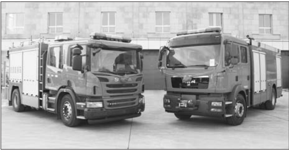
两辆消防车验收合格后,将在初家中队服役。

程,仅用半天时间就形成了战斗力。据悉,两辆消防车验收合格后,将在大队初家中队服役,投入日常执勤备战。 据介绍,多功能城市主战消防车集个人防护、破拆、牵引、照明、发电为一体,将在灭火救援中发挥巨大作用。抢险救援车具有动力性能好、携带器材多、方便使用器材、车体灵巧等特点,可为消防官兵火场或救援现场,提供充足的器材保障。