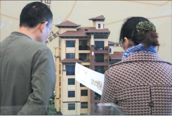
精挑细选，买房不吃亏。

客厅和卧室的选择，看购房者的需求。而生活区和开放区的隔离，则更有助于营造安静的生活环境。对于北方人，朝南户型能提供更多的阳光。