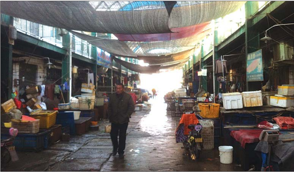
海鲜市场生意冷清。

今年以来,禁止高规格公务接待的政策多次下发。8日,《党政机关国内公务接待管理规定》更加细化了公务接待的具体要求,其中规定“工作餐应当供应家常菜,不得提供鱼翅、燕窝等高档菜肴。”10日,记者走访高档海鲜批发市场和泰城部分星级酒店,发现鲍鱼、海参等高档食材销量明显下降。星级酒店经营者也调整经营策略,将主要服务人群转向普通市民。