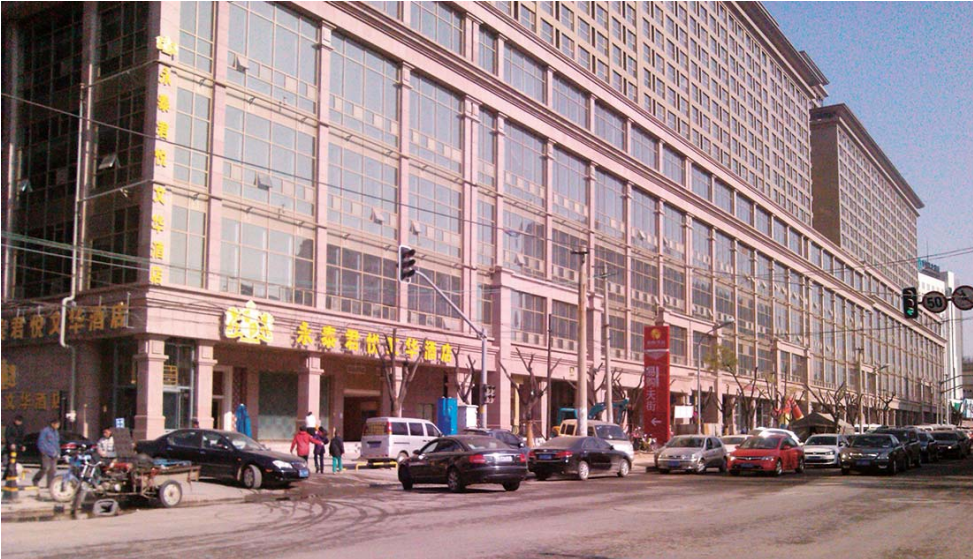
易购天街已成为和平路商圈备受关注的商业项目

工分三个阶段进行:第一阶段(6月—9月底),实施工程范围内的拆迁,完成热力、供水、燃气、雨污水、通讯等各类管线敷设。第二阶段(10月—2013年底),完成行道树就近移植。同时,完成路灯、交通、电车等设施建设。第三阶段(2014年5月底前),全面完成慢行一体建设,完成快车道面层铺设。