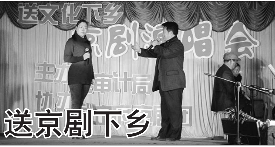
为活跃村民文化生活,倡导健康向上的娱乐休闲方式,进入11月以来,惠民县审计局利用村民农闲时间回家过冬的有利时机,协调县武定府京剧团到淄角镇部分村庄开展“送文化下乡”文艺演出活动,受到当地村民的欢迎。

本报12月11日讯(记者 王娟 通讯员 牛新华) 12月9日,惠民县审计局召开党组会议。会议结合审计工作实际,要求全体审计干部要把思想和行动统一到三中全会的精神上来,充分发挥审计机关在推进国家治理体系和治理能力现代化进程中的作用。会 议主要从三个方面入手学习提高审计工作。 建立预警机制。对审计工作的关键环节,绘制审计工作流程图,量化流程各个环节的操作标准,让每名审计人员清楚该做什么、不该做什么,从源头上防控廉政风险。 全程廉政监督。完善廉政 纪律公示制、廉政监督员责任制、执行审计纪律情况登记报告制等制度,实现审计组从进点到出点的全过程廉政监督。 把握重点环节。结合工作特点,梳理常见的不廉洁现象,严控廉政风险易发环节,把内容、要求、措施具体化,确保廉政警戒、防控到位。