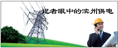
记者眼中的滨州供电