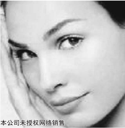
本公司未授权网络销售