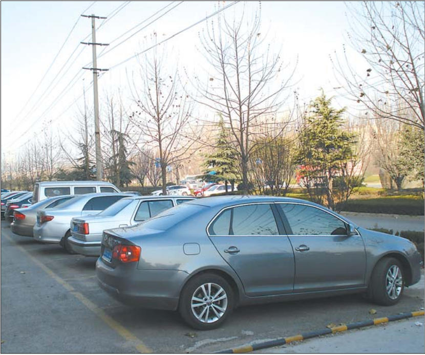
警方称,不少伪基站就藏在车的后备箱里。

采访中市民朱先生向记者反映,上个月他在城区内某小区买了套房子,自从买房后他的手机每天会收到十几条垃圾短信,几乎都是与建材和室内装修相关的公司发送的。“不仅发短信,还有直接打电话的,真不知道这些公司是通过什么渠道得知我的手机号码,严重侵犯了我的个人隐私。”朱先生气愤地向记者表示。据了解,一些不法分子投机取巧,利用高价“购买”商家手中的客户资料已是相当普遍的交易,这种交易已经严重侵害了客户的个人隐私。 董先生在注册一家公司后,由于登记了姓名和手机号,不断接到各种代开发票、代开增值税发票的短信和电话,“这些很明显是冲着刚注册的老板去的业务短信,客户资料只能是注册公司所涉及的工商、税务、行政审批大厅这些机关工作人员私下卖掉的。” 除了一些手机用户的资料遭到非法泄露外,伪基站已经成为垃圾短信的主要源头。在大学路文化产业园附近,记者的手机信号出现问题,却接二连三收到某企业的垃圾短信。目前伪基站已经形成了一条非法产业链。据记者了解,伪基站即假基站,是时下新兴的高科技诈骗设备。“现在的伪基站非常简单,可以给三公里内10万手机发送短信,一台主机、一台笔记本电脑、一个信号发射器就能组装成一套伪基站设备。”一名业内人士向记者介绍,伪基站经常隐蔽在人群密集的区域,覆盖该区域的信号强度高于移动网络的信号,然后自动搜索附近手机卡信息,向手机用户强行发送垃圾广告或诈骗短信。 通过查看一些垃圾短信不难发现,大