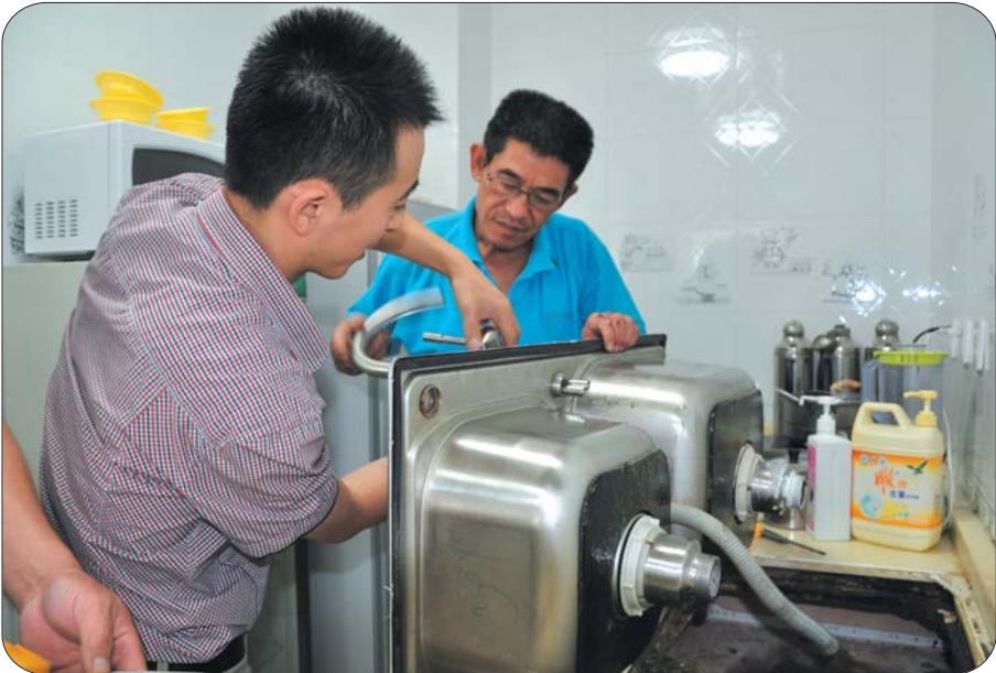
儿童福利院安装现场

据了解,福利院食堂还有8套水龙头需要更换。由于福利院部分水龙头需要进行调货,12月11日,这些特制的水龙头终于到达烟台。