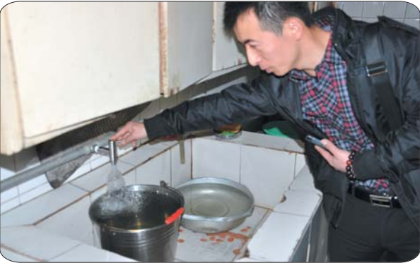
辅读学校安装现场