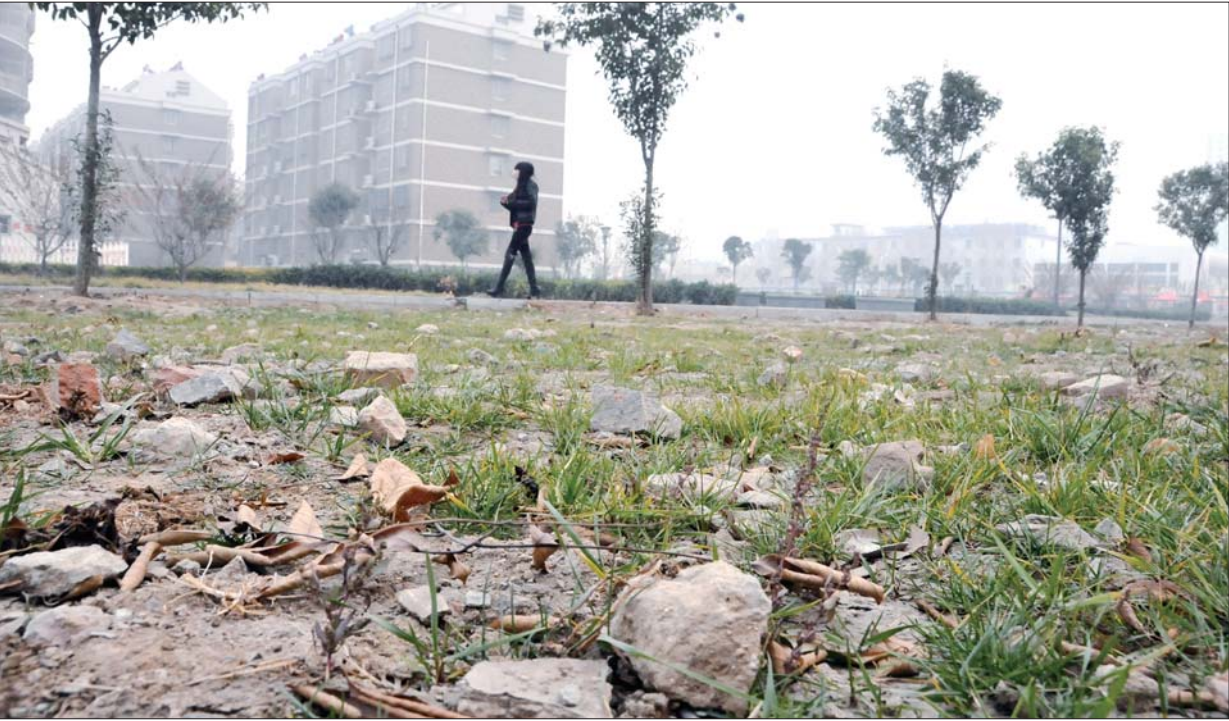
▲济宁城区某社区内,绿地近年来无人管理,杂草丛生。