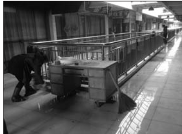
一些业主正在清理积水。