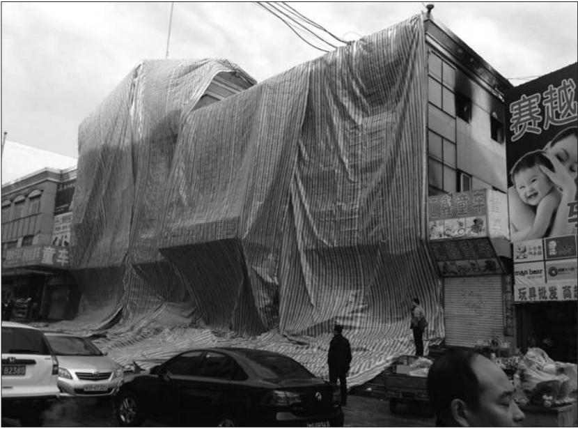
过火的丰华商城B座被整个遮起来。

据了解,经消防人员扑救,大火在当天凌晨三点左右被扑灭,由于是停业时间,未造成人员伤亡。目前,起火原因尚在调查中。