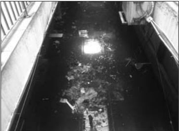
灭火后,商城内到处是水。