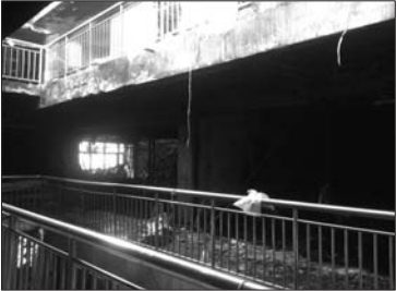
二楼三楼的几间商铺全被烧毁。