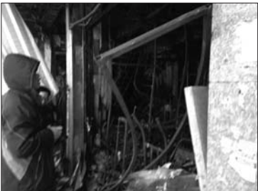
工作人员在现场勘查。