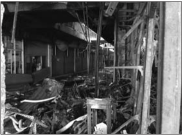
一楼一店铺被烧得一片狼藉。