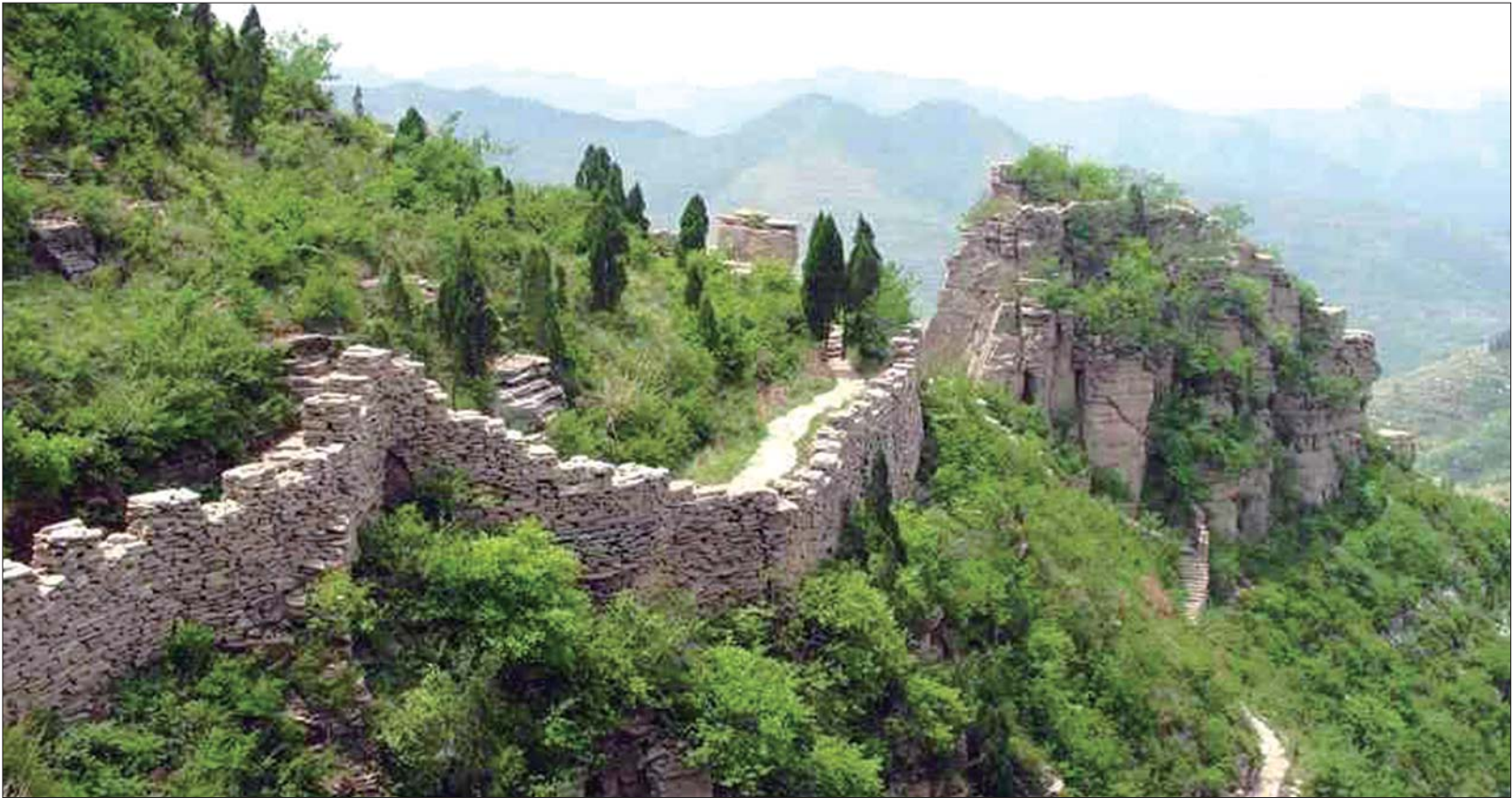
大峰山齐长城。（资料片）