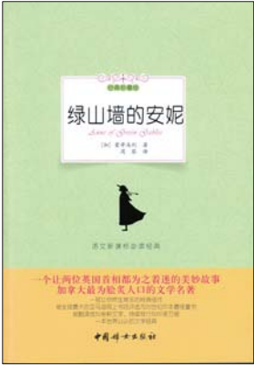
中国妇女出版社《绿山墙的安妮》封面。