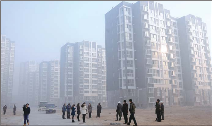
工作人员向媒体记者介绍康馨雅苑经适房项目。

有几栋平方。“该征收现场实施的是先建安置房再拆迁,126户拆迁户已有118户安置完毕。”市房管局拆迁服务中心张主任介绍称,今年以来,菏泽市实施房屋征收项目55个,征收房屋面积423.33万平方米,同比增长1.41倍,动迁居民19322户。