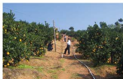
频振式杀虫灯、滴灌技术