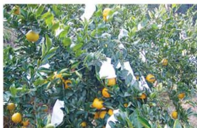
果实套袋防冻技术