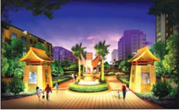
次入口夜景效果图