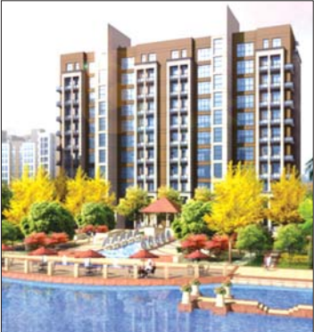
中心水景尊贵楼王