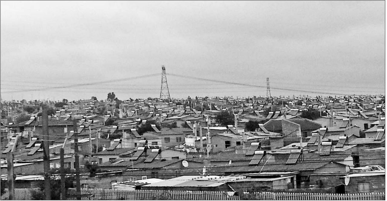
南非政府为贫困人群修建的免费住房。