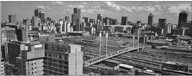
南非约翰内斯堡市中心的高层建筑。(资料片)

这意味着南非政府或将最终放弃免费住房政策,转而走上“对非正式定居点的棚屋区进行升级改造”、“为低收入家庭提供购房贷款扶持”的轨道上来,以甩掉“免费住房”这个沉重的包袱。