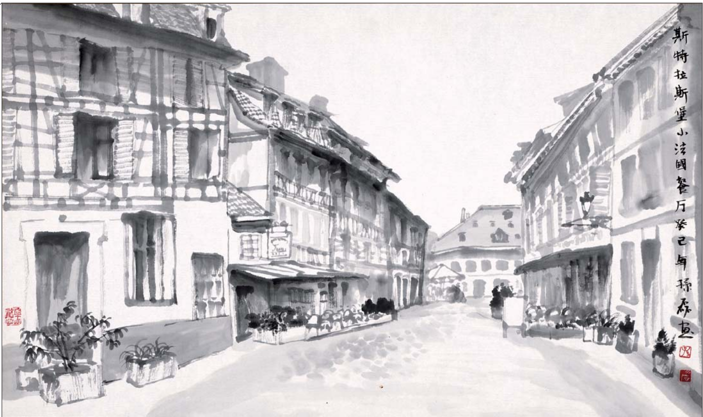
▲斯特拉斯堡小法国餐厅 70x35cm