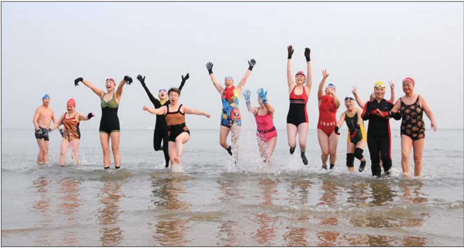
5日,虽为“小寒”节气,但在第一海水浴场,一群冬泳爱好者不畏寒冷洗海水浴,庆祝即将到来的春节。

另外,9日到15日期间,有两次弱冷空气影响过程,预计出现在12日和14日前后,降温幅度将在6℃以上,市民朋友应提前注意预防。