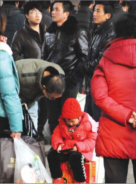
沉浸在手机世界中的孩子。