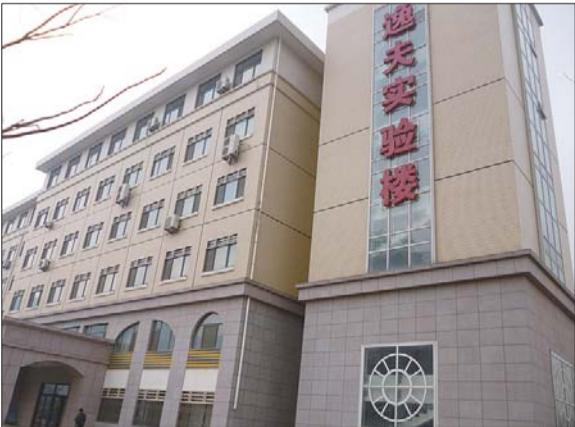
鲁东大学把逸夫实验楼打造成先进实验楼。