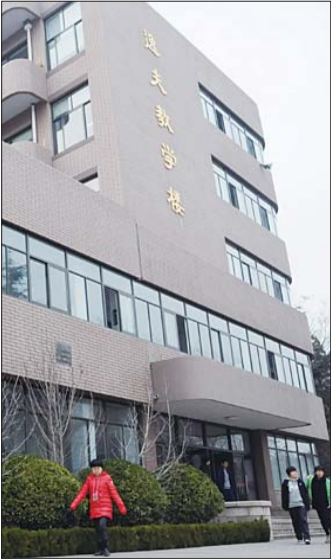
7日,烟台二中的逸夫教学楼前人来人往。虽然邵逸夫离开了我们,但其善举和记忆都凝在逸夫楼中。

“愿他一路走好!”听闻邵逸夫去世的消息,韩女士祝福道,她曾是烟台二中的学生,当时在逸夫教学楼上课的日子已成了记忆中难忘的情景。