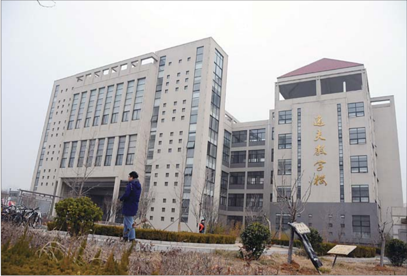
来到山东工商学院西校区,在校门口即可看见“逸夫教学楼”五个大字。