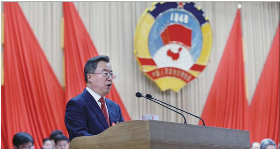
8日,烟台市政协主席郝德军作政协工作报告。

决策部署,坚持创新引领、重点带动,坚持谋大事议大事、抓落实求实效,切实发挥协调关系、汇聚力量、建言献策、服务大局的作用,为推动全市经济社会发展作出新的更大贡献。 市政协副主席江林昌受政协第十二届烟台市委常务委员会的委托,向大会作了关于提案工作情况的报告。