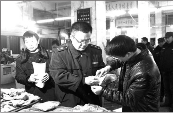
执法人员正在封存抽样样本