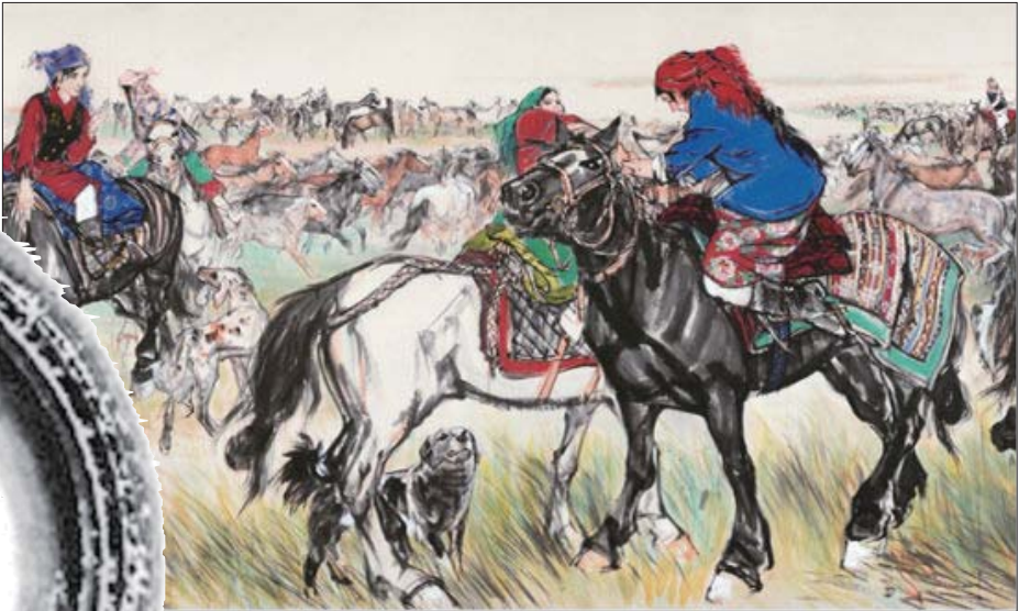
2013年黄胄的《欢腾的草原》(局部)以1.288亿元成交。

书画市场历经了近两年的低迷走势,尤其是2012年近乎“腰斩”的下滑,2013年12月2日,保利秋拍近现代书画夜场中,黄胄的《欢腾的草原》以1.288亿的成交价,不仅刷新了黄胄个人的拍卖纪录,也成为今秋内地书画拍卖市场上唯一过亿的作品。让在书画市场中严寒苦守的收藏和投资人士似乎嗅到了一丝回暖的气息,而黄胄作品的此拍,是否真的带领书画市场重回亿元时代?