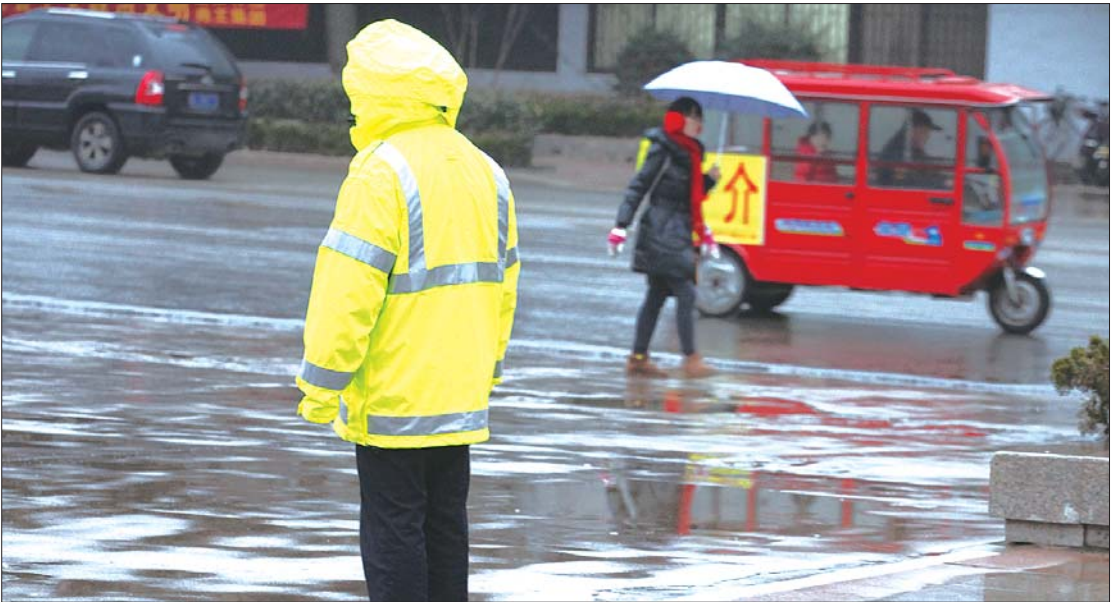
交警在雨中执勤服务两会。