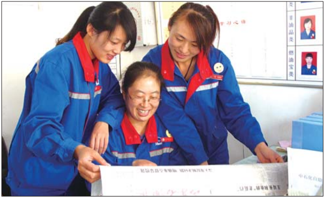
工作之余时间,中石化日照市区22站的员工们养成了读报的好习惯。

条整改。在“查摆问题,开展批评”这一关键环节,党委一班人深刻进行自我剖析,自我批评,查找思想根源,并提出了整改措施。这是去年民主生活会的新做法。