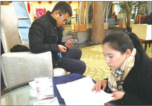
本报记者在酒店驻地联系委员进行采访。