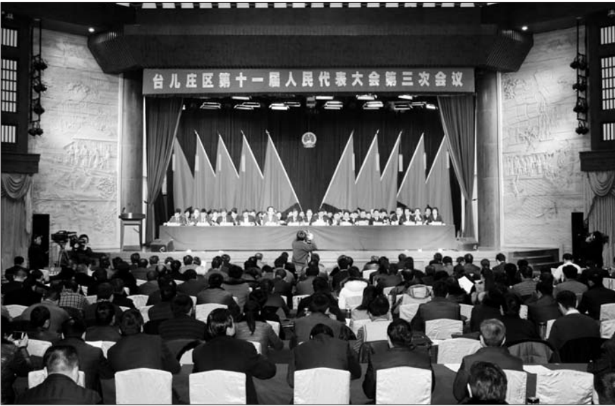
大会现场。