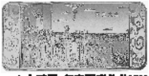
▲金砖图:每套配赠价值1580元开国大典大金砖,物超所值!

全套耗用了高达190余克纯金银按照目前金店工艺金银的市场价格估算,光是金银的价值就已接近6980元的原始首发价,更别提例的超级划算,买到就是赚到。