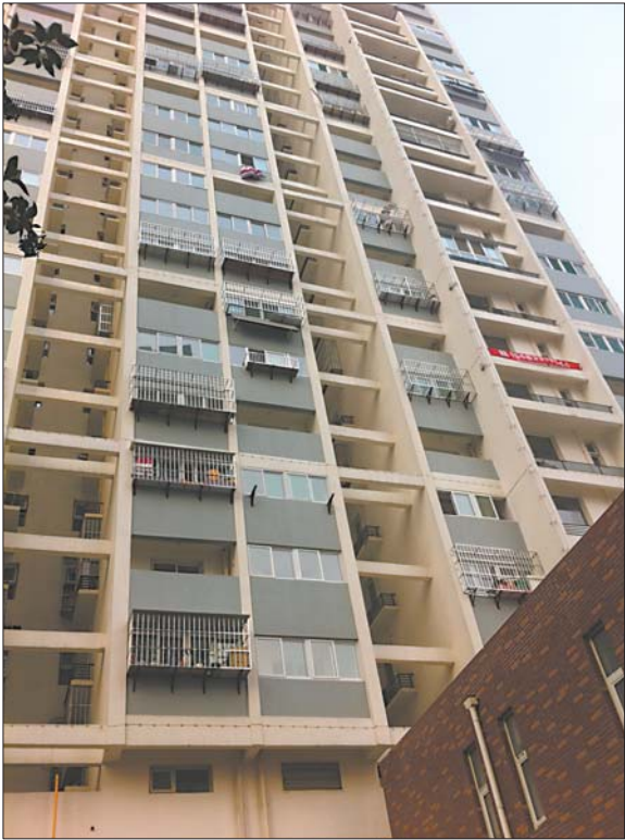
►男孩是从晒有被子的13楼窗户处坠楼的。

随后记者从医院了解到,坠楼的男孩确实已经死亡。当时只有男孩同学的妈妈随救护车到医院,目前男孩家人还没有到。