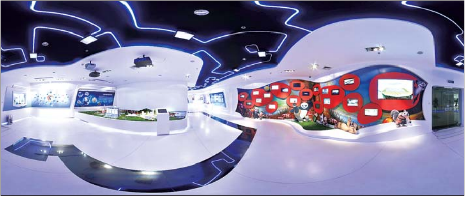
科技展厅。