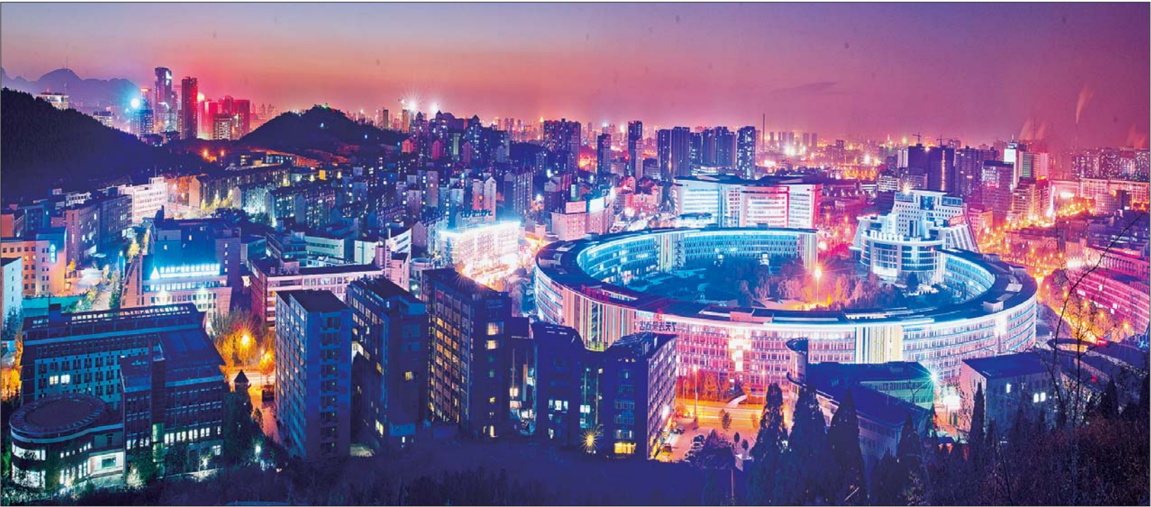
高新之夜。