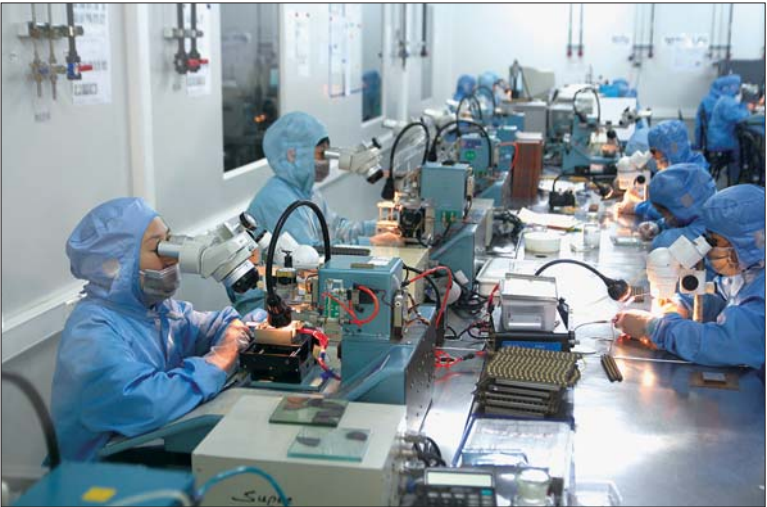
浪潮华光。