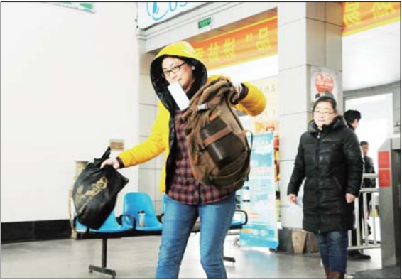
拿起行李，匆忙奔向客车。