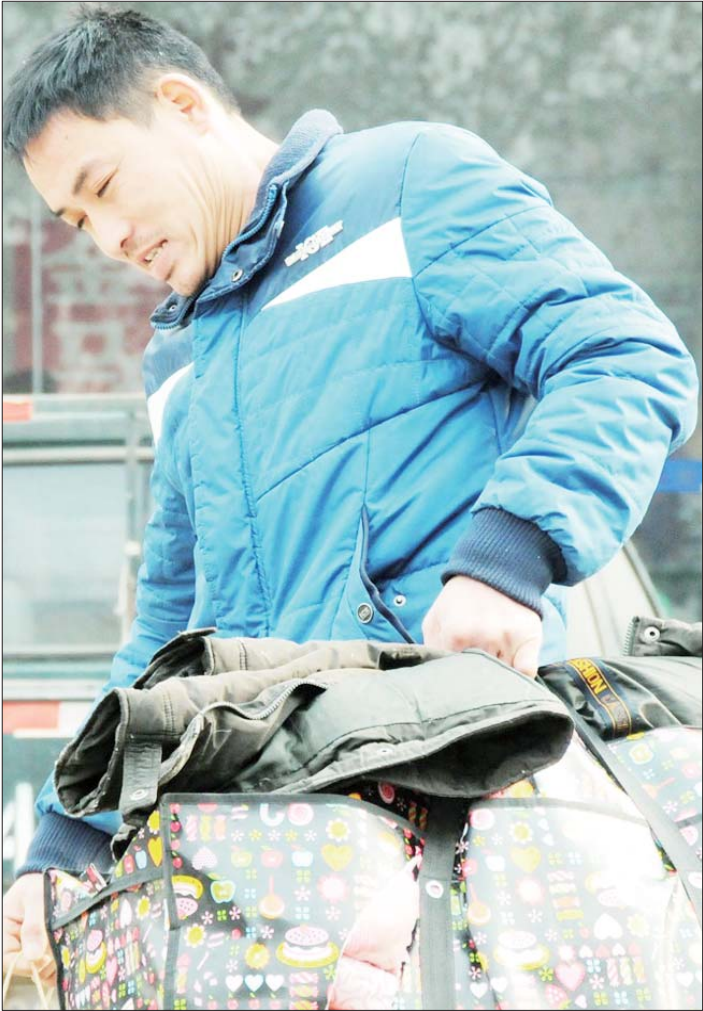
行李很重，但回家的心情很好。