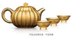
产品以纯金为底,平安祥瑞

壶韵乾坤系列是中国工商银行首次以茶壶为题材精工打造的贵金属产品。皇家风范,传世再现。《心经》云:“照见五蕴皆空,度一切苦厄。”工行打造的心经壶首次将乾隆御笔心经册页之精华雕于金壶之上,祥瑞之气融于大智慧之中。福佑平安,珍贵非凡。