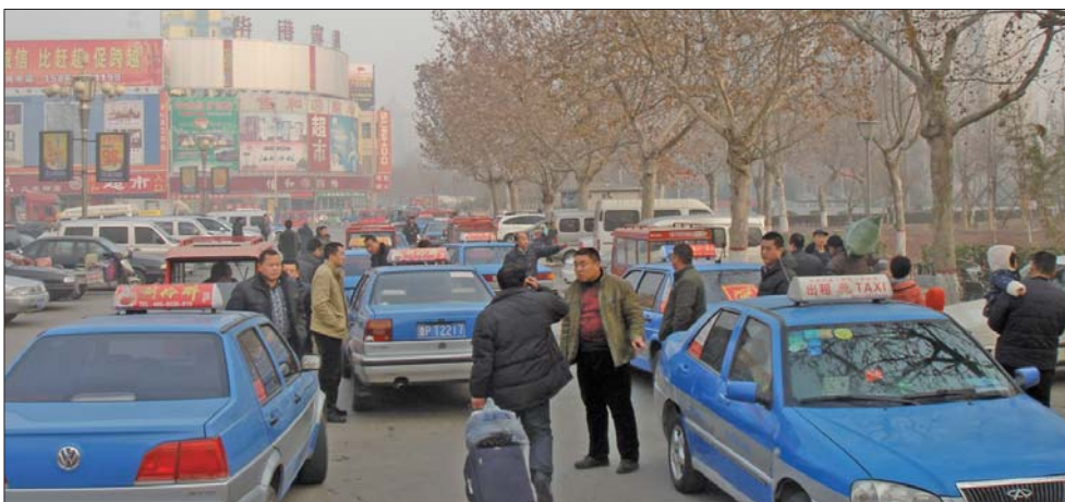
▲火车站北出站口被封。