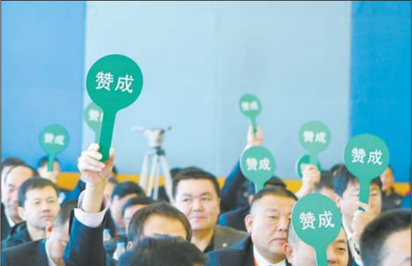
大会表决通过《中国足球协会工作报告》。

相关业内人士表示,从现有的材料和情况来看,“申花新赛季留在上海,应该是没有问题的”。此外,如果近期有新的市场主体对申花现股东的股份进行收购,那么有了新东家的申花俱乐部可能会撤销仲裁申请。