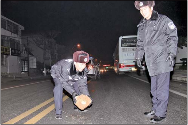
▲半夜,道路上的危险“因素”,也是巡警需要解决的。