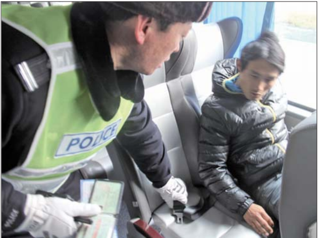
▲为保障旅客平安出行,民警加强安检并上车提醒乘客系好安全带。