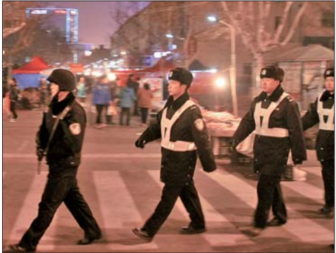
▲市区街头不时可见巡警。