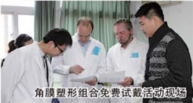
角膜塑形组合免费试戴活动现场