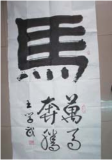
著名书法家王学武作品。