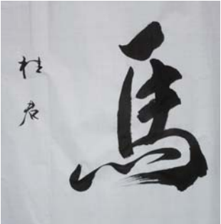
著名书法家王桂君作品。