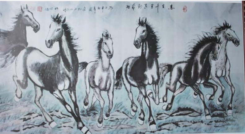
知名画马画家褚诗斌作品。