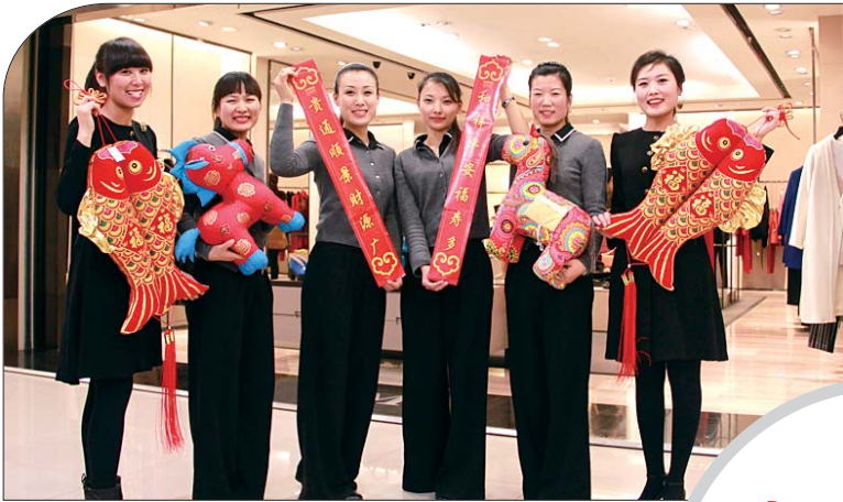
贵和购物祝全市人民幸福安康!