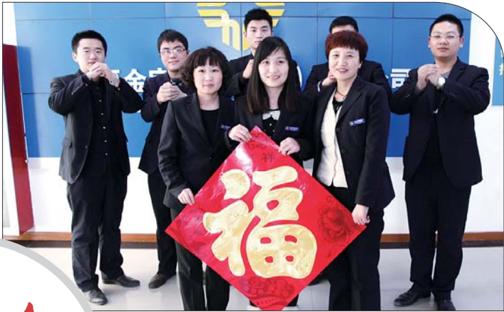
金宇家居祝全市人民生活幸福,阖家欢乐!