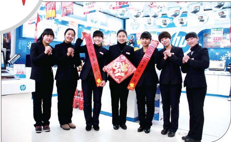
济宁九龙家电祝全市人民生活美满!