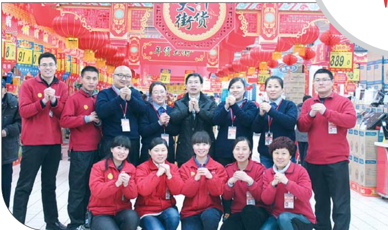
济宁大润发超市祝全市人民马年幸福!