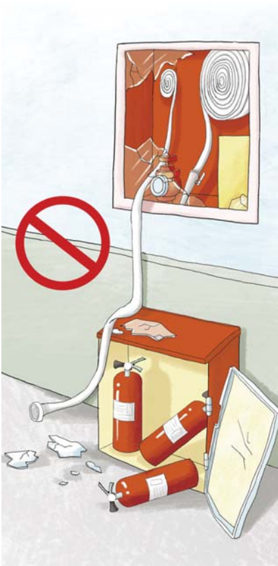
不损坏消防设施和器材