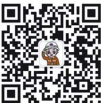
泰安消防官方微信