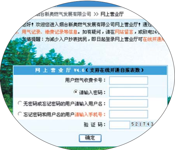
点开“网上营业厅”后，登录信息就可进行操作。

据介绍，之前很多抄表员并非新奥燃气的职工，而是外包员工。实行用户自报表数后，人力需求量大大大降低，公司自己的员工已经能够满足抄表和安检需求。