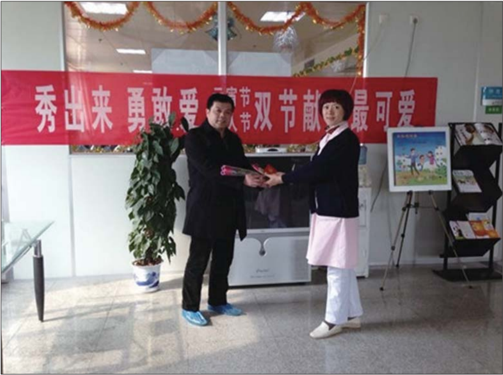
血站工作人员为献血者送上玫瑰。

束,血站工作人员又为献血者送上了一碗碗热腾腾的汤圆。汤圆象征合家团圆,吃元宵意味新的一年阖家幸福,万事如意。献血者们品尝着汤圆,既献出了爱心,又收获了一份节日的祝福。 爱,让团圆更近,在这一刻,献血者们用爱心搭建了桥梁,促成了更多家庭的圆满,成就了更多家庭的合家欢!(纪小川)