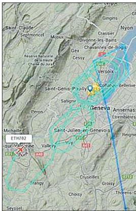
ET702航班被劫持后在日内瓦上空的盘旋路径。