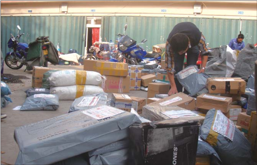
快递业务量增加,一些快件容易造成积压。(资料片)

该工作人员介绍说,崔女士的快件现在已经回到了分公司,会尽快安排投递。19日下午2点多,崔女士收到了快件。