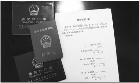
办理准生证需要户口本、结婚证等证件和婚育证明。

来查询处理,让他们尽量去重庆办理。为了顺利将准生证办下来,两人在去年11月一起去了妻子的老家重庆巫山县。 “先坐火车再转轮渡,从淄博到重庆,太折腾人了。我俩都上着班,尤其是年纪也不小了,真想快点办下来。”张先生说。尽管辛苦,但抱有希望的张先生夫妇准备好了所有资料,跑遍了重庆的相关单位。重庆巫山县计生办工作人员告诉他们,所需资料已基本备齐,唯独缺一份男方的初婚证明。但这份初婚证明,必须得在山东办。