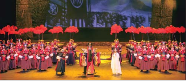
果穿越回到秦朝时,与秦始皇一起来到烟台,遇到了芝。

本报2月26日讯(记者 陈莹 ) 28日晚,烟台市“第十二届专业艺术团演出季”烟台大剧院场馆的首场演出,由烟台市歌舞剧院带来的原创歌舞剧《海市》将正式亮相。作为近两年来烟台歌舞剧院精心打磨的歌舞剧,《海市》一个时下流行的“穿越”形式,将古往今来烟台的本土元素有机地融合,讲述了一个“古老”与“现代”的爱情故事。