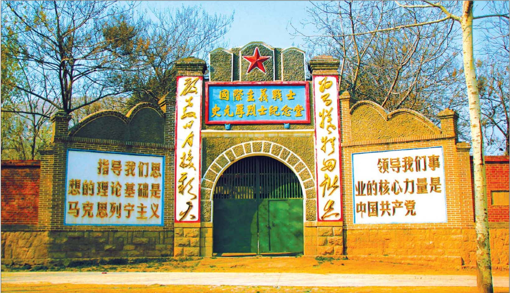
修缮后的史元厚烈士纪念堂大门显得很有时代感。

长清区历史悠久,人杰地灵,从古至今曾涌现出大量的仁人志士和英雄人物。上世纪五十年代,在抗美援朝战场上,中国人民志愿军的两位战士,为了抢救两位落水的朝鲜儿童而光荣牺牲,这两位战士一位是罗盛教,一位叫史元厚。罗盛教家喻户晓,而史元厚的事迹却少有人知了。