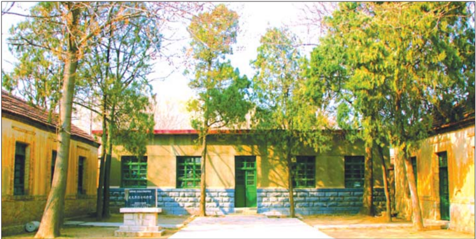
纪念馆院内西侧立有济南市重点文保碑。

尽管史元厚烈士的事迹感天动地,但了解他生平事迹的人却少之又少,将英雄们的事迹与高尚品格传承下去是我们每一个人的责任。史元厚烈士牺牲已60年了,尽管省政府为其修建了纪念馆,但纪念馆内各种布置和陈列过于简单,对烈士事迹的宣传也非常少。所以笔者在此建议社会各界,少修座庙宇少塑尊神,争取在纪念馆内外雕刻一座史元厚烈士塑像,另外在马山镇驻地以及长清区的相关广场上,也应当有相同或相近的史元厚塑像和事迹介绍,这样才能和纪念馆形成呼应和互动,以使广大市民知道烈士的生平,了解烈士的事迹。