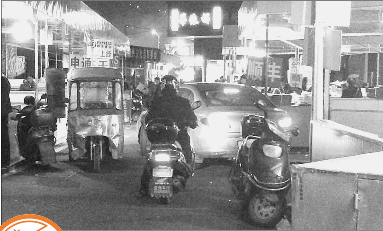
晚上的安福市场灯火辉煌,车水马龙。几十个快递收货点在这里忙着收货填单。