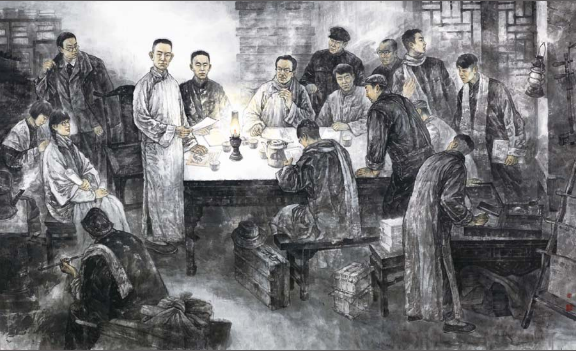
▲《寒夜星火——1921·济南马克思学说研究会》 220x360cm 王磐德、周群合作